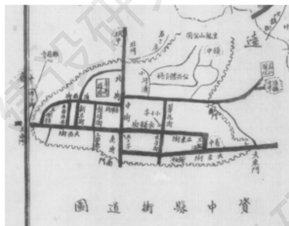
资中县地街道图（民国三十三年绘制）

资中历史城区内的建筑大部分已翻建，大部分街巷尺度和功能已发生转变，建筑变高、街道变宽，历史氛围已然淡薄，但古城总体街巷格局和轮廓仍能分辨，街巷布局延续了清朝城池道路布局的基本特征。街道格局清晰，部分历史街巷肌理仍清晰完整，界面多元丰富。