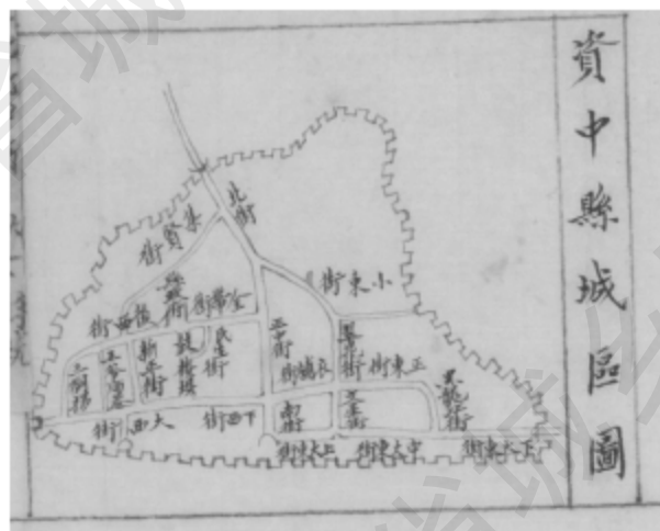
资中县城区图（民国三十一年绘制）

明清时期资中古城道路系统基本定型，主要分布在城墙以内，形成了“一墙九门、十字街巷、西治东学中为商”的格局，兼具军事防御功能和防水功能，形成了古城独特的传统风貌。古城中街—南街与西街—正东街形成的十字交叉处为中心形成分区，城内南北方向的巷道与东西向主要街道相连，构成了交通网络。